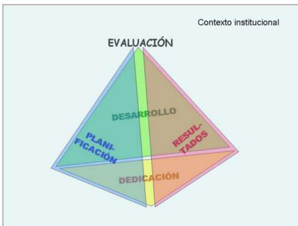
Figura 2. Dimensiones de evaluación de la evaluación docente

El Modelo de evaluación definido en el que se fundamenta el procedimiento para la evaluación de la actividad docente de la Universidad de Alicante, contempla las tres dimensiones establecidas por ANECA en el programa Docencia en el análisis y valoración de la actividad docente: Planificación de la Docencia, Desarrollo de la docencia, y, Resultados. Cada una de estas dimensiones se articula a su vez en un conjunto de elementos, todos ellos representados en la Figura 2.