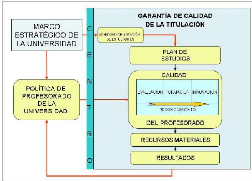
Figura 1. Evaluación del profesorado en el marco de un sistema de garantía de la calidad.