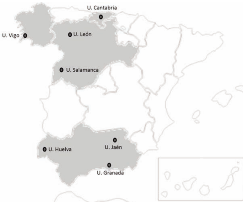
Figura 2 Distribución geográfica de las Universidades participantes en el Proyecto uniHcos

La recogida de información comenzó en diciembre de 2011, habiendo participado hasta ese momento un total de 1.363 individuos. Las encuestas se realizaron mediante cuestionario ad hoc online autocontestado, a través de la plataforma SphinxOnline®, que permite la creación de dos archivos