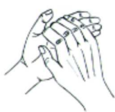
Palma sobre palma